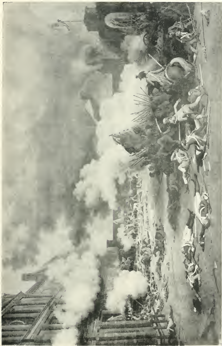
LA JOURNÉE DU 10 AOUT 1792 (PRISE DES TUILERIES)